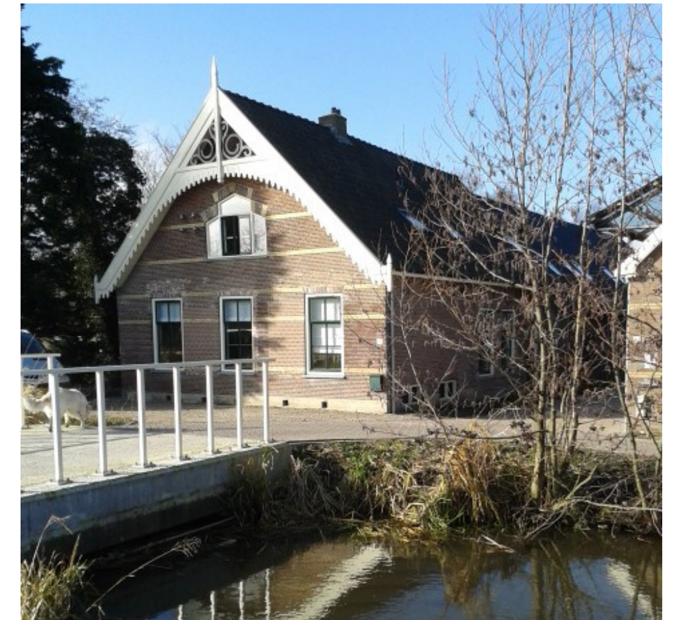
Nieuwe bestemming aan het historische lint Zegwaartseweg.

De Zegwaartseweg is één van de historische linten die Zoetermeer rijk is. De gemeente heeft de waarde daarvan erkend en in 2016 is een nieuwe visie door de gemeenteraad vastgesteld. Behoud van het landelijke karakter van de Zegwaartseweg, met zijn doorkijkjes, vanaf de dijk staat voorop; de perenboomgaard is nadrukkelijk één van de groene elementen in die visie. Daarnaast is uiteraard het behoud van de vele monumenten die langs de dijk gelegen zijn toonaangevend. Ontwikkelingen staan echter niet stil, maar de nieuwe visie zorgt er bij bouwactiviteiten wel voor dat het historische karakter behouden blijft. Oude panden herontwikkelen voor eigentijdse functies is de uitdaging, een mooi voorbeeld is de Herbergier.