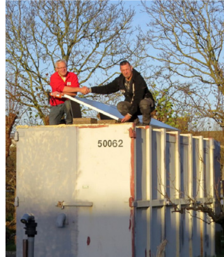
Zonnepanelen in de Hof van Seghwaert.

De verbindingen tussen de vier kernwoorden zijn divers en stimuleren we zeker. We zijn er van overtuigd dat er boeiende interacties zullen ontstaan tussen 'groen' en 'historisch' of tussen 'sociaal' en 'duurzaam' enzovoorts. De vier kernwoorden maken in hun samenhang het verschil.