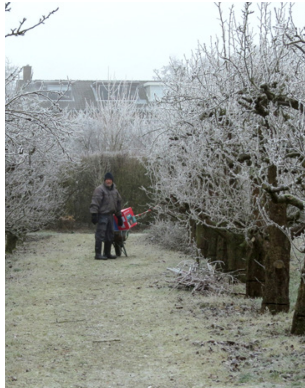
Ook in de winter gaat het onderhoudswerk in de perenboomgaard door.

groep zijn velen nog actief en gezond. Als deze wijkbewoners allemaal een klein deel van hun tijd aan onze wijk willen besteden, dan blijft Seghwaert een mooie plek om te wonen en op die manier ook aantrekkelijk als vestigingsplaats voor de jonge generaties. Wil je meedoen, en dat kan ook als je niet gepensioneerd bent, neem dan contact op met Bert Dekkers, dat kan via: gijbertdekke@live.nl