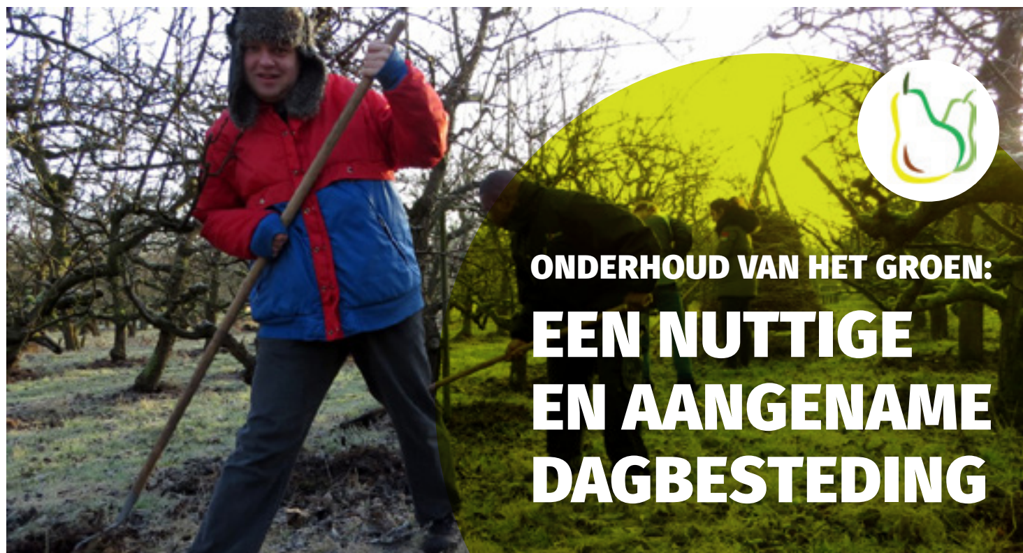
Middin-clënten in de weer met het verzorgen van de perenbomen.

In de Hof van Seghwaert mag iedereen meedoen. Op eigen kracht of, als dat nodig is, onder begeleiding. Wij werken samen met steeds meer organisaties in de wijk die dit uitgangspunt onderschrijven met voordelen voor beide partijen. Twee voorbeelden.